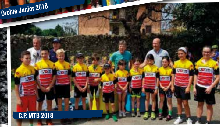
C.P. MTB 2018