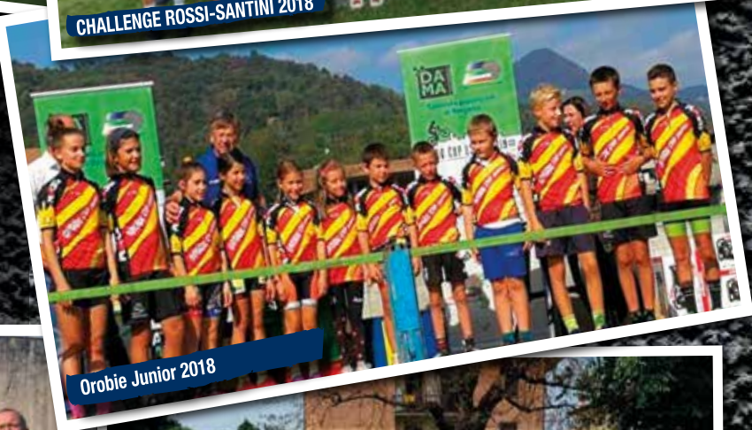
Orobie Junior 2018