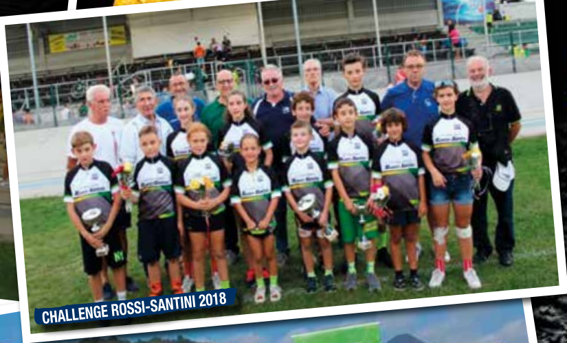
CHALLENGE ROSSI-SANTINI 2018