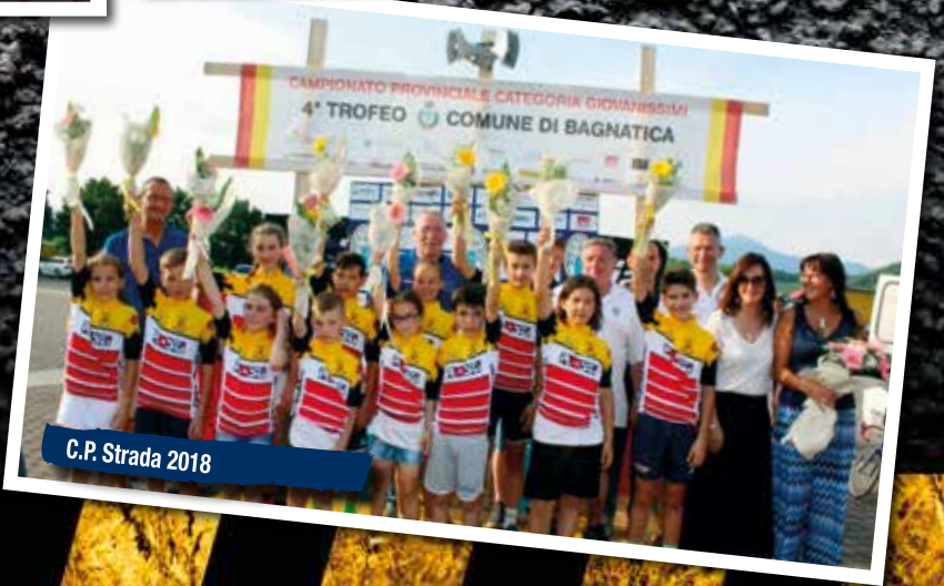
C.P. Strada 2018