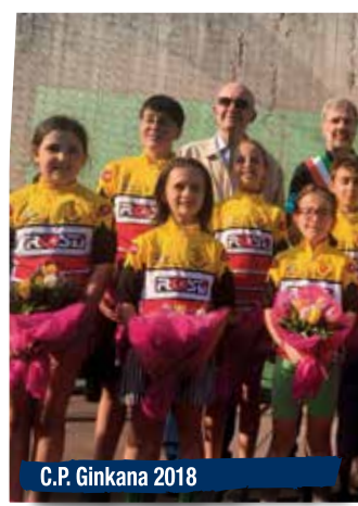
C.P. Ginkana 2018