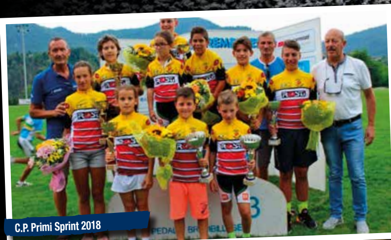
C.P. Primi Sprint 2018