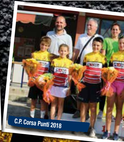
C.P. Corsa Punti 2018